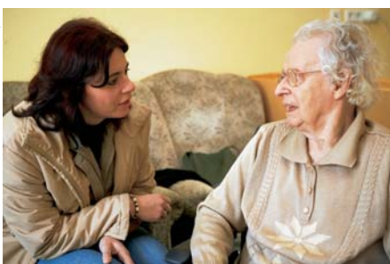
Bewohner/innen werden nach positiven und negativen Eindrücken im Heim befragt.

die dreistufige Auswertungssystematik (Abbildung 1). Die erste Auswertungsebene ermöglicht mit einer grossen Anzahl von Antworten aussagekräftige Vergleiche zwischen messenden Heimen (Benchmarking). Die zweite Auswertungsstufe wertet die Antworten pro Bereich nach einzelnen Unterkategorien aus. Für